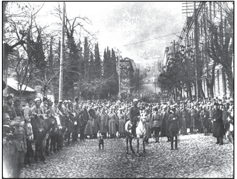
წითელარმიელების შემოსვლა საქართველოში 1921 წლის თებერვალი

პოლიტიკურ უფლებებს განურჩევლად ეროვნებისა, სარწმუნოებისა, სოციალური მდგომარეობისა და სქესისა.