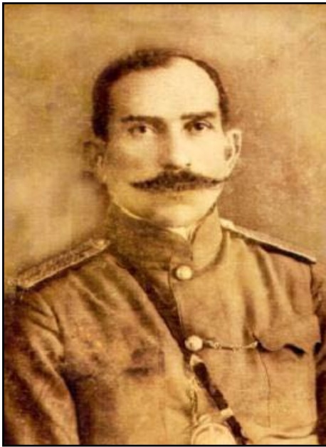
გენერალი გიორგი მაზნიაშვილი

მასშტაბური სამხედრო წარმატება, რომელმაც მნიშვნელოვნად განსაზღვრა აფხაზეთის მომავალი. მართალია მოგვიანებით ბოლშევიკებიც და დენიკინის მომხრეებიც ცდილობდნენ აფხაზეთში ანტიქართული აჯანყებების მოწყობას, მაგრამ მათ მიზანს ვერ მიაღწიეს და ეს რეგიონი საქართველოს განუყოფელ ნაწილად დარჩა.