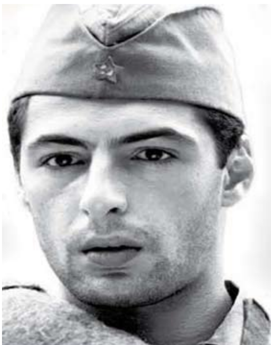
(31) ნოემბერი-დეკემბერი 2010