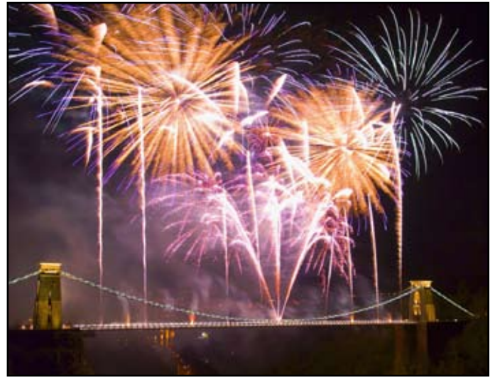
ახალი წელი საფრანგეთში

დღეს - 13 იანვარს იულიანური კალენდარით. ხალხი სეირნობს ქუჩებში სხვადასხვა „კოსტიუმებში“ გამოწყობილი. მათ ახურავენ ქუდები, რომლებიც კეთილ და ავ სულებს წარმოადგენენ. მათ სჯერათ, რომ ნაღების პატარა წვეთის დაცემას იატაკზე კარგი ბედი და სიუხვე მოაქვს.