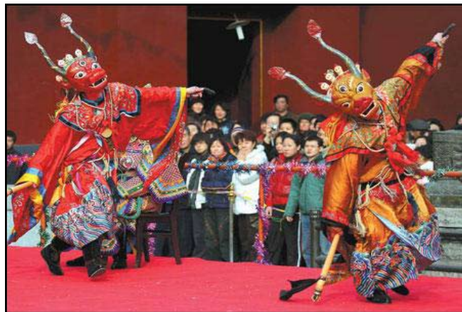
ახალი წელი ტიბეტში

იქ ახალი წელი აღინიშნება იანვრის ბოლოს ან თებერვლის დასაწყისში, ახალი მთვარის დროს. ძველი წლის ბოლო დღე სახლის დასუფთავებას ეძღვნება, განსაკუთრებით სამზარეულოსი. იწმინდება აგრეთვე საკვამლე. ახალი წლის პირველი დღისათვის სპეციალური წვნიანი მზადდება, რომელიც 9 შემადგენელს შეიცავს - ხორცს, ხორბალს, ბრინჯს, ტკბილ კარტოფილს, ყველს, მუხუნოს, მწვანე წიწკას, ვერმიშელს და ბოლოკს. სუპს მიირთმევენ ხინკლისმაგვარ კერძთან ერთად, რომელიც შეიცავს ხის ნარჩენებს, ქაღალდს და ხრემს, რის საშუალებითაც წარმეტყველებენ როგორი მომავალი ელით - კარგი თუ ცუდი.