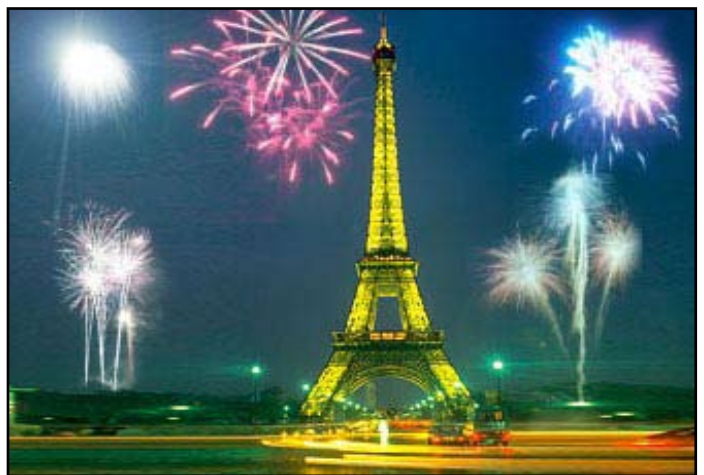
ახალი წელი საფრანგეთში

ინდოეთში ახალი წლის ზეიმი არის შუქების ზეიმი და სხვადასხვანაირად აღინიშნება ქვეყნის