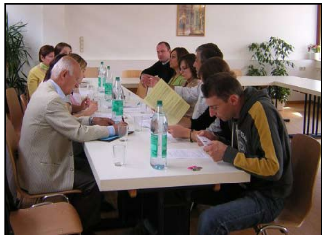
სათვისტომოს სამუშაო შეხვედრა

გარდა ამისა, სიამოვნებით შეგვიძლია ჩვენი გამოცდილება გავუზიაროთ ყველას, ვისაც საკვირაო სკოლის დაარსება სურს. ამ ეტაპზე ფრაიბურგის ქართველებთან ვაწარმოებთ მიმოწერას, ასევე ლაიფციგში ყალიბდება სკოლა. ჩემის აზრით, ყველგან, სადაც არის შესაბამისი რაოდენობის ქართველი ბავშვი, აუცილებელია საკვირაო სკოლის ჩამოყალიბება.