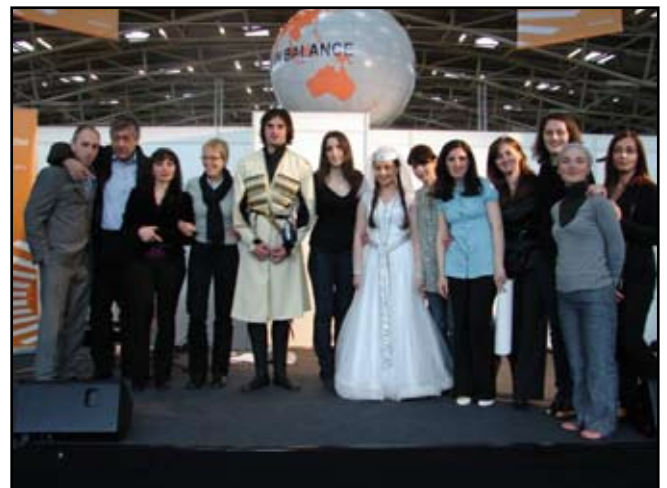
ტურიზმის პროექტის წარმომადგენლები მიუნხენის საერთაშორისო გამოფენაზე

წელს, სულ რამოდენიმე თვის წინ სათვისტომოში, ასევე ახალგაზრდების ინიციატივით, ჩამოვაყალიბეთ საქართველოში ტურიზმის ხელშეწყობის ჯგუფი, რომელმაც მოკლე დროში დაამტკიცა უკვე ამ მიმართულებით სამუშაოების ჩატარების უდიდესი მნიშვნელობა და საჭიროება. თქვენ წარმოიდგინეთ, სტუდენტი გოგო-ბიჭები უკვე საკმაოდ პროფესიონალურად უდგებიან ამ საკითხს და გვაქვს რამოდენიმე შემოთავაზება თანამშრომლობაზე სხვადასხვა გერმანული საზოგადოებებისა და