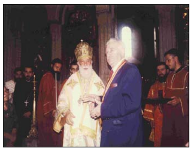
ქრისტეფორე კირკიტაძე საქართველოში ვიზიტისას შეხვედრა პატრიარქთან