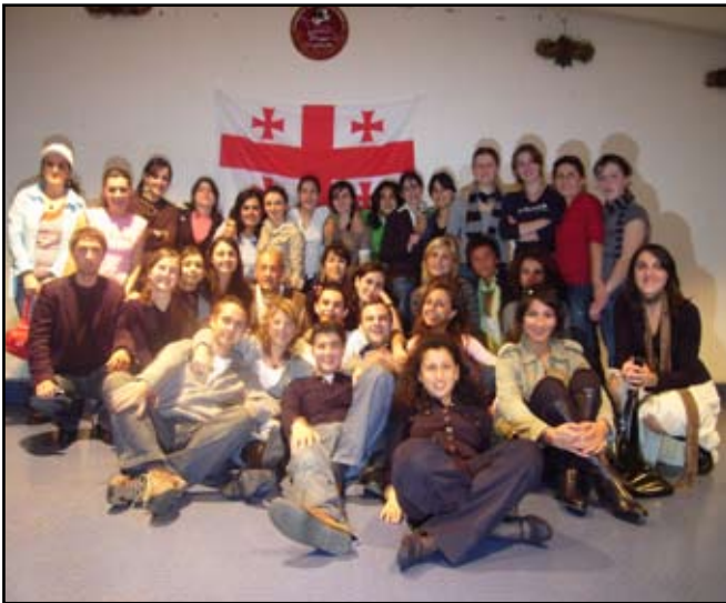
Au-Pair-ებისათვის ორგანიზებული საინფორმაციო შეხვედრა

წარმოიდგინეთ, ეს საქმე იმდენად მნიშვნელოვანი აღმოჩნდა, რომ ბოლო ერთი წლის განმავლობაში (პროექტი უკვე 3 წელია ფუნქციონირებს) ისე არ გადის კვირა, რომ ერთმა „ოპერმა“ მაინც არ ითხოვოს დახმარება. ყველა სატელეფონო ზარი იწყება სიტყვებით – მიშველეთ მე ამ ოჯახში ვეღარ გაეჩერები, მე მაქვს უდიდესი პრობლემები, რადგანაც ოჯახი ჩემთვის მიუღებელ ქმედებებს ახორციელებს. არის შემთხვევები, როდესაც „ოპერის“ მხრიდანაც ხდება გაუგებრობების წარმოშობის ხელშეწყობა, ძალიან ხშირად კი ჩვენც გოცებულები ვრჩებით თვითონ ოჯახების მოქმედებებით.