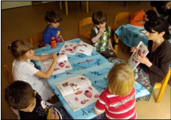
გაკვეთილზე საკვირაო სკოლაში

ბავშვის ქართულ საკვირაო სკოლაში მოყვანიტ შეიძლება. აქ ის ხედავს, რომ არსებობენ სხვა მისი თანატოლებიც, რომლებმაც ქართული ენა იციან და, ხშირ შემთხვევაში, მოხარულიც არის, რომ თვითონაც ჯერ კიდევ შეუძლია რამოდენიმე ქართული სიტყვის თქმა.