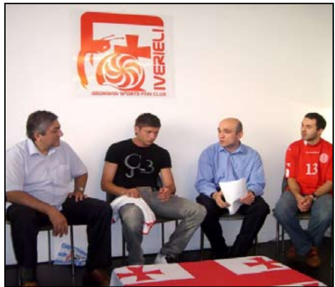
ქომაგთა კლუბის შეხვედრა ფეხბურთულ მათე ღვინიანიძესთან

ასევე გვაქვს ძალიან საინტერესო პროექტი „ქართული სპორტის ქომაგთა კლუბის“ სახით, რომელიც ძალიან ხშირად ახერხებს ქართველი სპორტსმენების გაცეხას, როდესაც მათთვის მოულოდნელად ქართული დროშები იშლება დარბაზებში თუ ტრიბუნებზე და ხდება მათი უსაზღვროდ ემოციური მხარდაჭერა. ვფიქრობ, ეს ამ შორეულ ადგილებში ძალიან მნიშველოვანია