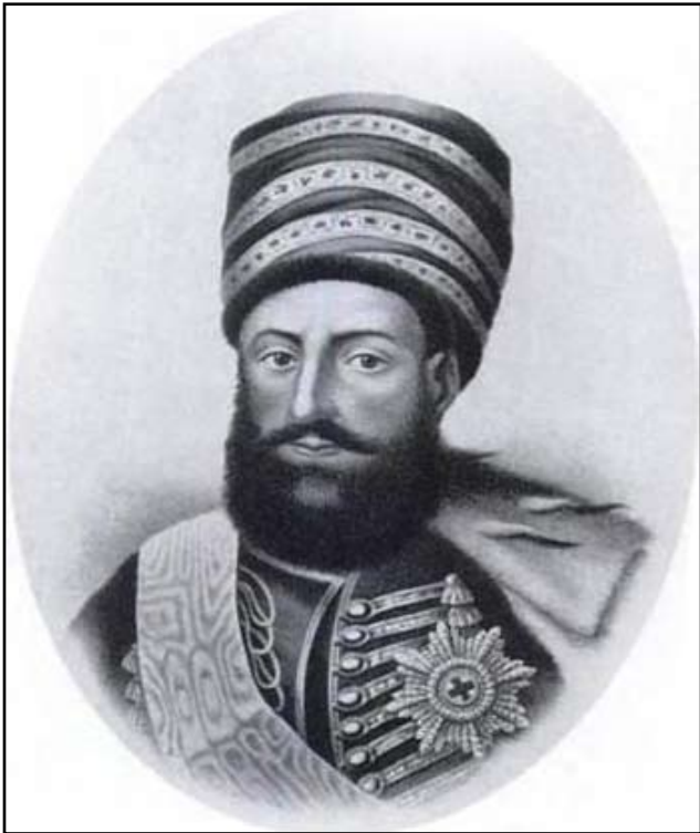
მეფე ერეკლე II

ქართველთა ლაშქარში 3000 მეომარი იყო აზატ-ხანს კი 18000 კაცი ჰყავდა.