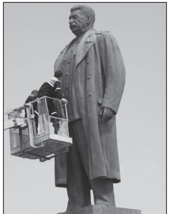
21 აგვისტოს, ღამით სტალინის ძეგლი უცნობ პირებს წითელი ფერის საღებავით გაუწუწუვთ.

აქციის ორგანიზატორი სტუდენტები კი ამბობდნენ,