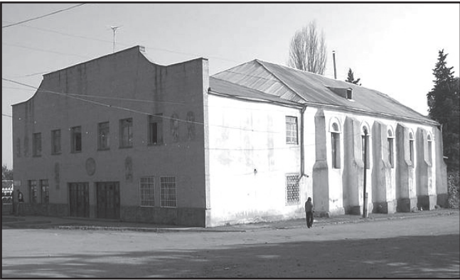
ეკატერინენფელდის ყოფილი ეკლესიის შენობა

ამით გლახთა მასების გადატაკება, რაც იწვევდა მათ მიგრაციას სხვა სახელმწიფოებში.